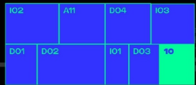
South Hall 1